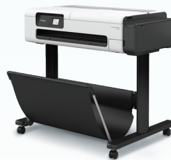
印表機支架 + 收紙籃