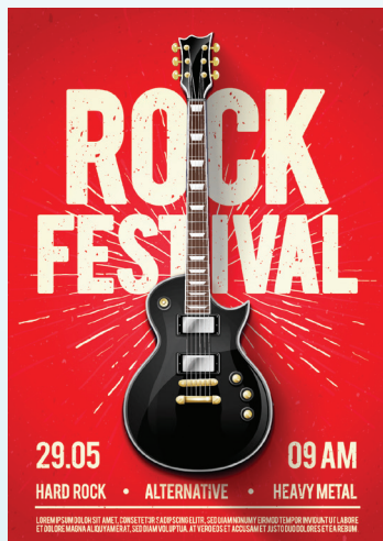
以紅色調 Vivid Red 色彩列印