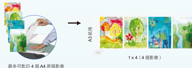
最多可影印 4 個 A4 原稿影像

多份原稿影像可影印為單一連續版面，並配合紙捲寬度。可配合最大 A1/24 吋的紙捲寬度。