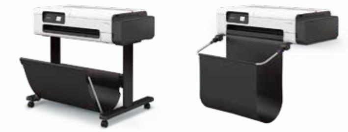
落地式支架 + 收紙籃