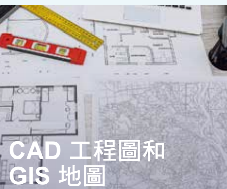
CAD 工程圖和 GIS 地圖