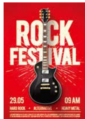
以紅色調 Vivid Red 色彩列印